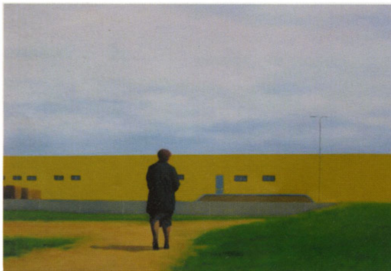
Șerban SAVU: fără titlu